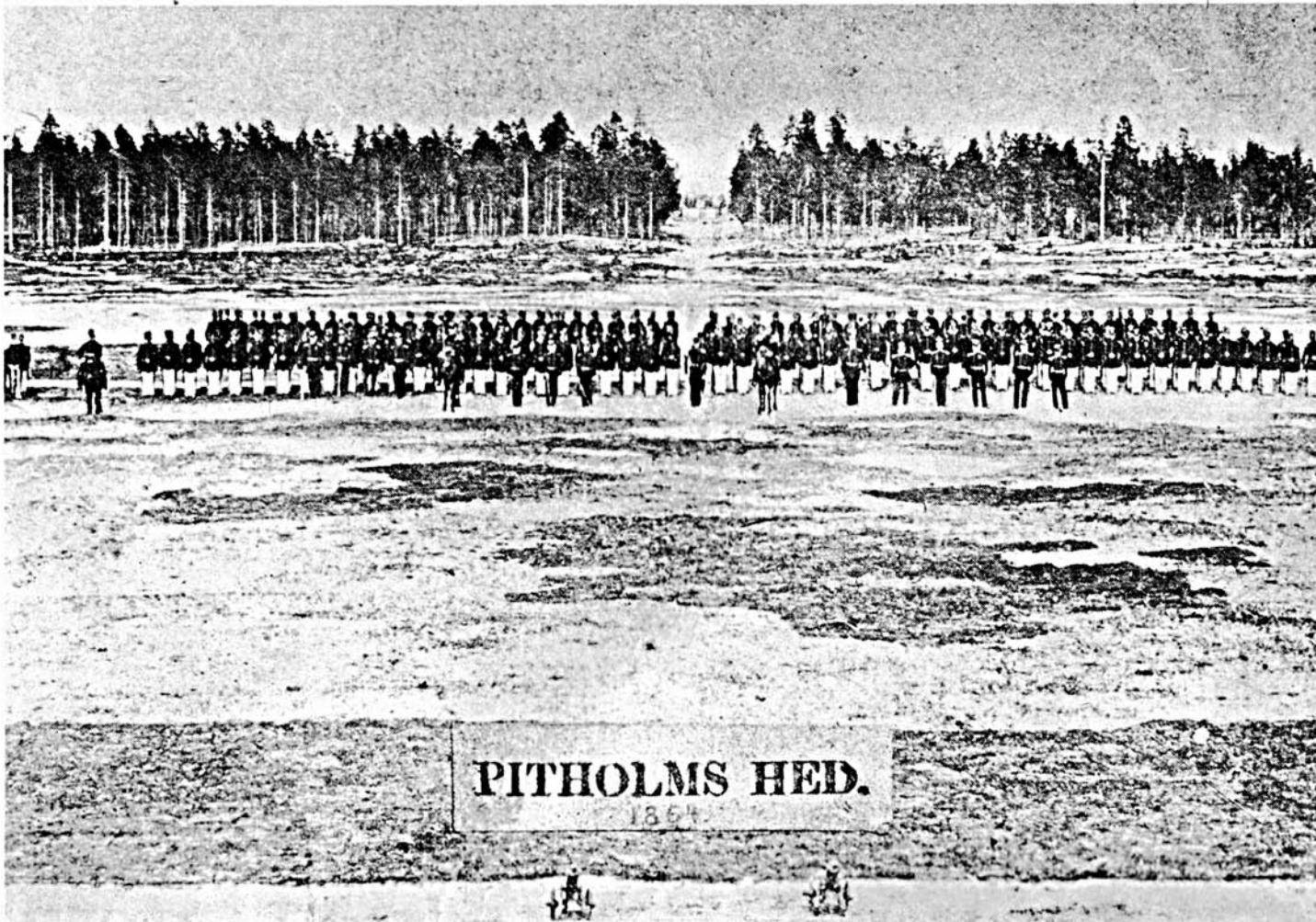
PITHOLMS HED. 1864

En bit snett ovanför denna villa visade pappa mej något, som hade varit en husgrund eller en stenfot och berättade att här stod kokhuset. Man kunde tydligt se ena hörnan, det övriga var täckt av drivsand. Pappa pekade. Här var krogen, här var befälshuset och här låg manskapsbaracken. I vinkel mot kokhuset några alnar