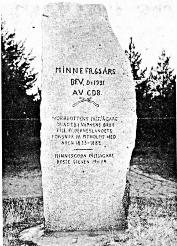
Folk från Hortlax såg till att den tunga stenen kom på plats.