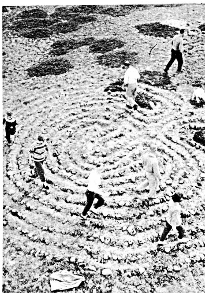
Att vandra genom den stora stenlabyrinten på Stenskar hörde till traditionerna.