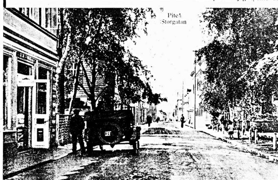
För en Pitsundspojke var det en upplevelse att få komma in till stan. Fastän stadsborna talade så fint att man själv föredrog att tuga . . .