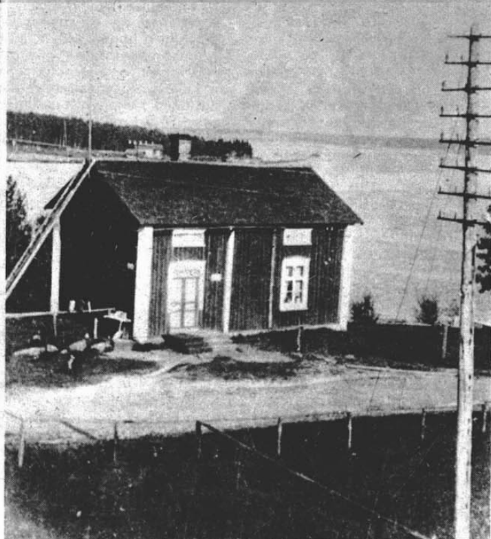
□ Särskilt mycket har färjkarlsstugan i Pitsund inte ändrat utseende under decenniernas lopp, det visar den här bilden från 1910-talet.